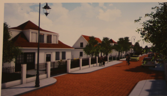
Projektowana zabudowa jednorodzinna wolnostojąca