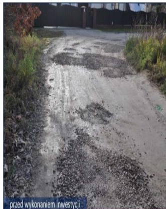
przed wykonaniem inwestycji

jezdnię asfaltową - koszt: 533 010,26 zł, kanalizację deszczową - koszt: 83 425,11 zł