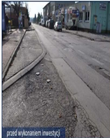
przed wykonaniem inwestycji