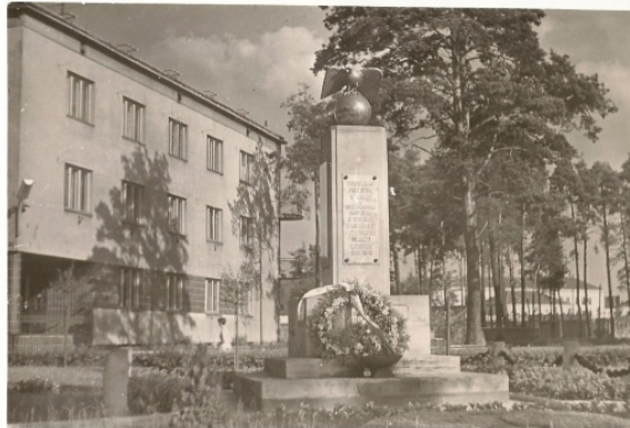
Pomnik poświęcony Bohaterom Starachowic 1939-1945

Pomnik znajduje się na skwerze przy zbiegu ulic Partyzantów i Konstytucji 3-go Maja. Pomnik został wykonany z piaskowca i odsłonięty 31 sierpnia 1979 roku. Treść napisu: BOHATEROM STARACHOWIC 1939-1945. 29 października 1945 roku został odsłonięty pomnik przy ul. Bema, który postawiono na hałdzie pokopalnianej. W miejscu tym zostały złożone szczątki ludzi zamordowanych przez hitlerowców w Starachowicach. W 1952 roku rozbudowa Fabryki Samochodów Ciężarowych spowodowała przeniesienie pomnika na skwer obok ówczesnej siedziby PZPR. Pomnik ten rozebrano w 1979 roku.