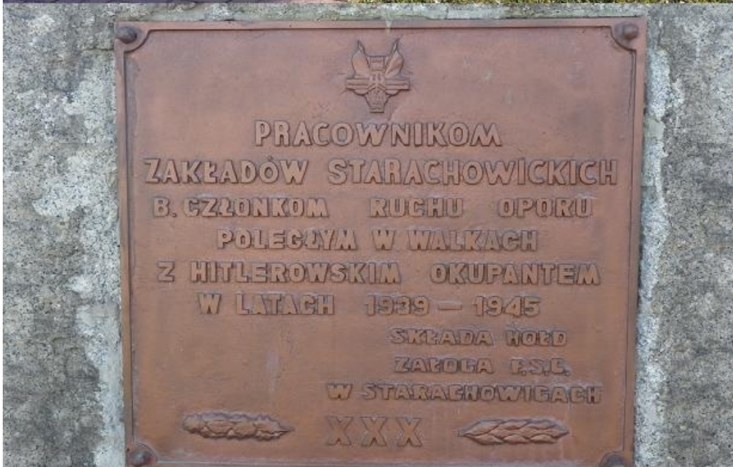
Pomnik poświęcony Pracownikom Zakładów Starachowickich poległym w latach 1939 - 1945