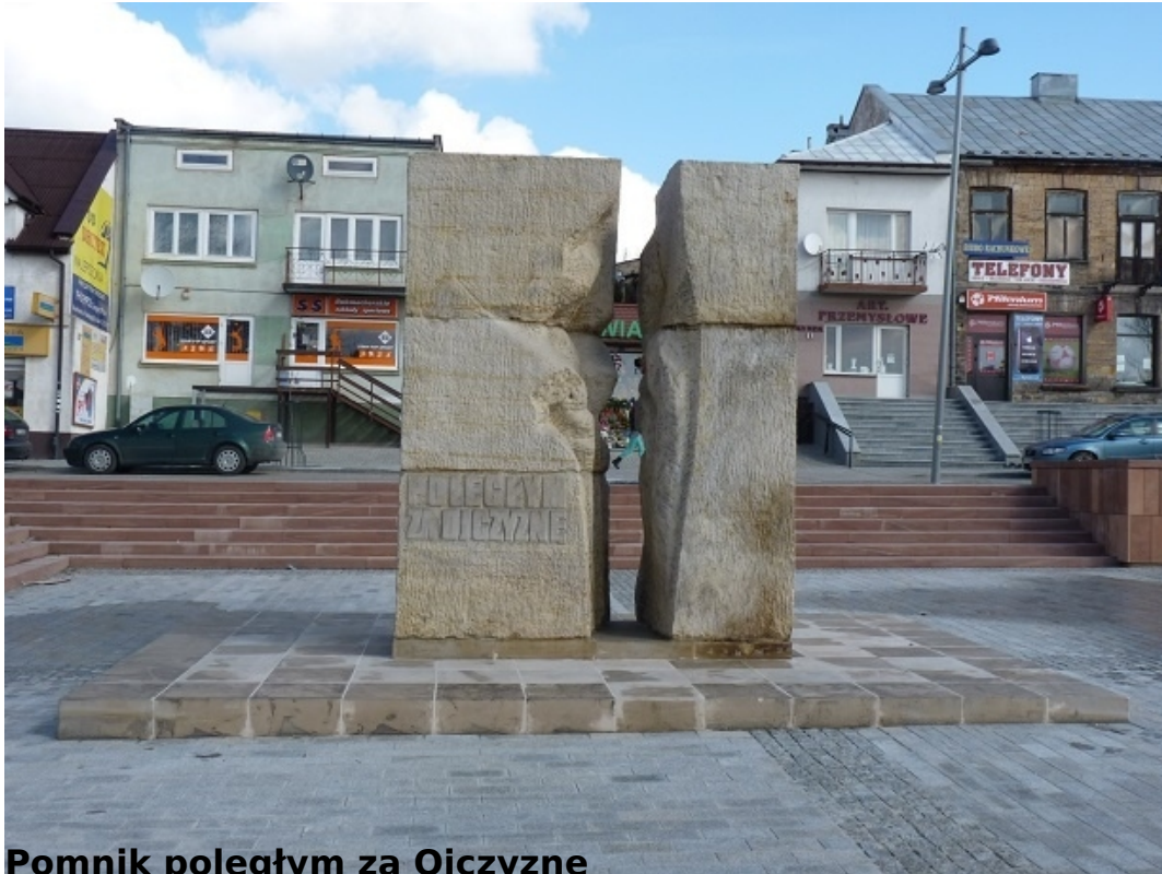
Pomnik poległym za Ojczyznę

Pomnik usytuowany na placu przy ul. Rynek. Wykonany z piaskowca. Odsłonięty 17 stycznia 1974 roku. Upamiętnia miejsce egzekucji dokonanych przez hitlerowców na mieszkańcach miasta, między innymi 16 Polaków (w tym 3 kobiety), powieszonych przez hitlerowców 6 września 1942 roku na placu Rynku. Na pomniku napis: od frontu: / POLEGŁYM / ZA OJCZYZNĘ /, z tyłu: / MIEJSCE EGZEKUCJI / DOKONANYCH / PRZEZ / HITLEROWCÓW / NA MIESZKAŃCACH / MIASTA / W ROKU 1942 / WZNIESIONO / W 30 ROCZNICĘ / 1944 - 1974 /