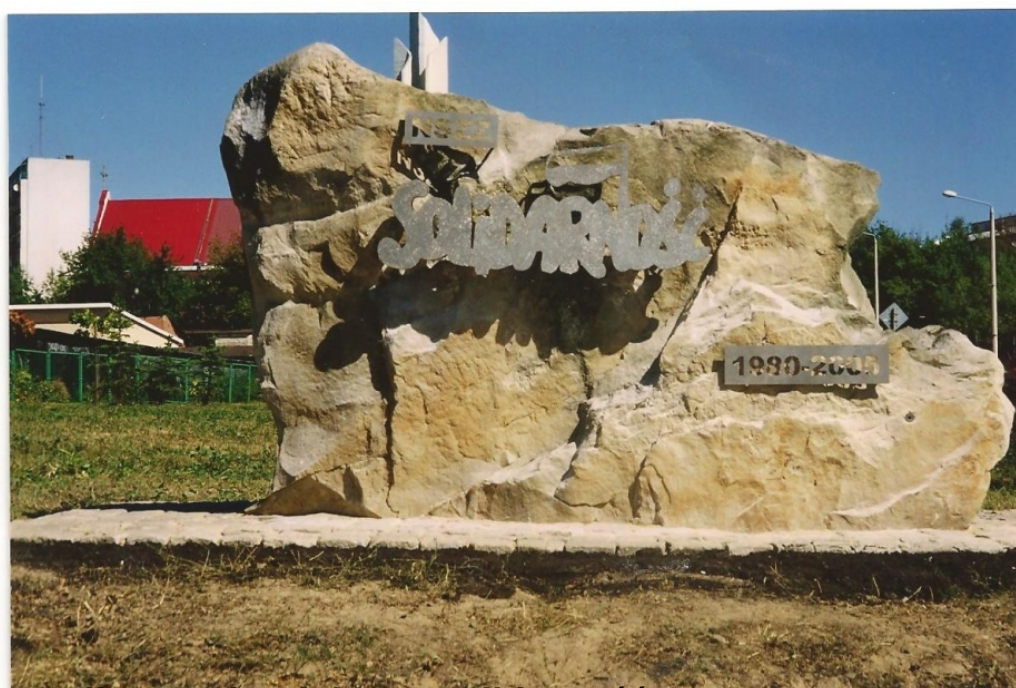
Pomnik upamiętniający „Solidarność”

Pomnik usytuowany na skwerze przy ul. Partyzantów. Wykonany z piaskowca ustawiony na betonowym postumencie. Na pomniku nie ma tablicy, ani żadnych napisów.